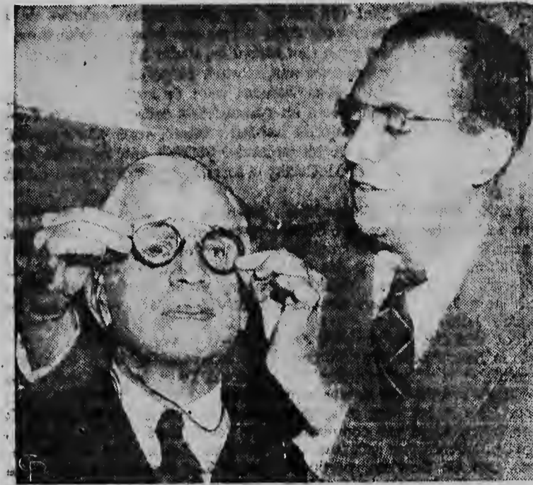
Den e proceso di e homber cu a bati su casa cu palu te ora e muri, e juez cu a trata e caso, a pas e bril pa e convene cu ta Sam Sheppard mes a eonieté e crimen. E proceso aki a tuma masha tempo y por ultimo Sheppard a worde sentencia pa bida largu. Como a presenta algun prueba nobo e caso lo bolbe ser habri fin di e siman aki.